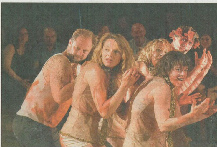
Un momento del espectáculo 'La dévorée' de Cirque Rasposo en la carpa del Atrio de San Segundo.

Tres años de reflexión y ensayos han dado como resultado este original espectáculo, en el que además de la música, a través de la cual se narra la historia, también tienen presencia los animales, algo que caracteriza a las creaciones de Cirque Rasposo, compañía que empezó haciendo teatro de calle y que desde hace quince años realiza sus montajes en carpa, cosechando grandes éxitos de crítica y de público, y siendo Premio Nacional de Circo.